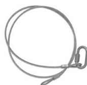
Fillin de sécurité x2