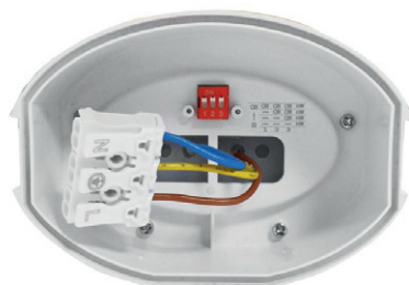
Connecteur rapide + Pico de réglage