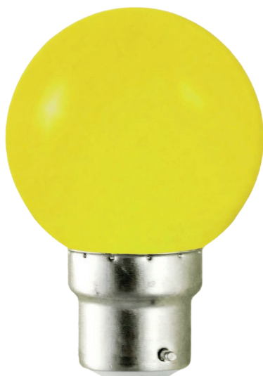
Ampoules incassables ( globe en polycarbonate)

Type : Bulb Culot : B22 Puissance absorbée : 1W Dimmable : Non Couleur : Jaune Lumens : / EN 62 471 : Groupe 0 Taille : 67 mm x 45 mm Emballage : Boite EAN : 3760173772902